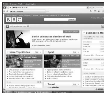
BBC 是英國社會的基石

在英國，BBC Trust和Executive Board都設有和財務有關的委員會。前者設的是Finance and Compliance Committee，後者設的是監察委員會（Audit Committee）。Finance and Compliance Committee委員會的職責包括審查BBC三年財務概要及年度整體預算的內容，以及代表Trust審查與通過電視執照費的年度徵收策略及數位轉換輔助計劃。監察委員會的職掌則包括對BBC企業管理的監督，尤其是和財務報告、內部控