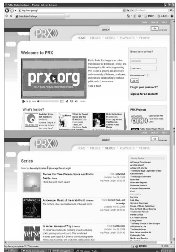
PRX匯集各方內容，讓公營電台更代表公眾的聲音。

公共廣播的互動元素，不單是在互聯網上載內容，而這些內容是會反饋到傳統傳媒。美國的Public Radio Exchange (PRX) 容許獨立製作人上載其內容到PRX