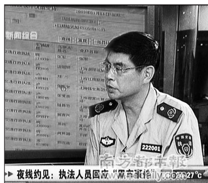
► 夜线约见：执法人员回应“黑車” 執法人員在九月十六日的電視節目採訪中態度強硬。

閔行區城市交通行政執法大隊的負責人，十六日在上海的電視節目中態度強硬，以「工作秘密」為由拒絕回答記者追問。同時該隊在「閔行黨務公開網」發文辯解。不過他們始料未及，就在這個網站發佈的公開文件中，記者發現該隊兩年來查處所謂無照經營的「黑車」五千輛，罰款數高達五千萬元。