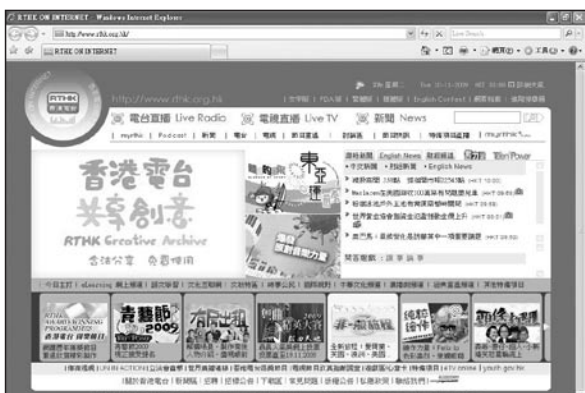
公共廣播在新媒體扮演著與別不同的角色。

本上要做到的是分配不同持份者有適當的代表，而且程序公開，任何希望參與的人士都有權參與，政府的角色反而只限於諮詢性質的「政府諮詢會」，即使當然有實際影響力，但無實權。多持份者管治多用於公共政策發展過程，但亦有像ICANN這種具體執行工作的機構例子。其實對香港電台的未來管治，多持份者管治式、由不同界別公開選出來的委員會，無論是顧問還是執行性質，都較行政長官委任能令社會接受。