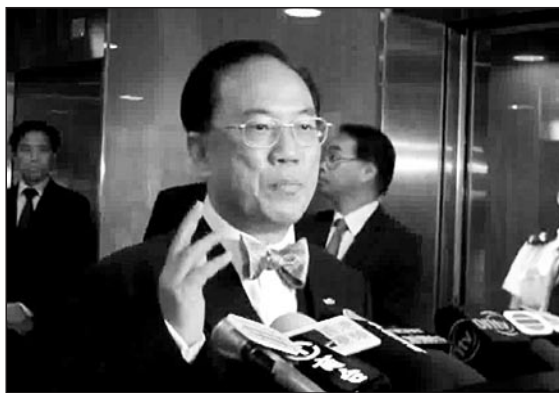
曾蔭權高調還擊輿論的指控。