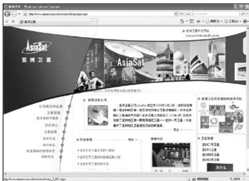
亞洲衛星公司獲廣播事務管理局發牌，批准在香港以衛星播放電視節目。

准在本港以衛星播放電視節目，亞衛決定在明年初啟播，將設立三十五至五十個頻道，提供全高清節目，以國際新聞、體育、旅遊、電影為主打，月費可低至一百多元，爭取免費及收費電視的客戶。亞衛擁有三枚衛星，將同時向港、澳、台三地以衛星發送電視節目，現已分別在本港和台灣獲發出衛星電視牌照。初步考慮在兩地招聘數十人，包括技術人員、業務人員和節目的輔助人員。若發展理想，日後更會針對港、澳、台觀眾口味自行製作節目，到時電視市場相信又有一場惡鬥。