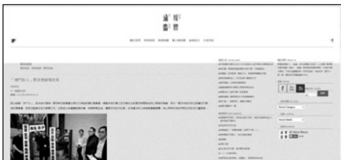
註五、因為河蟹，所以應該河蟹？《訊報》，2014年2月28日

澳門回歸後，中文日報由原來的八家增至十二家，中文週報增至十三家，電視台兩家(以有固定新聞時段計)，電台一家，網上獨立媒體兩家，包括以「惡搞」政治諷刺走紅的「愛瞞日報」，以及著重挖掘深度、詳於專題報道的「論盡媒體」。外文媒體方面，新增了三家英文日報，另外還有四份回歸前經營至今的葡文報章。