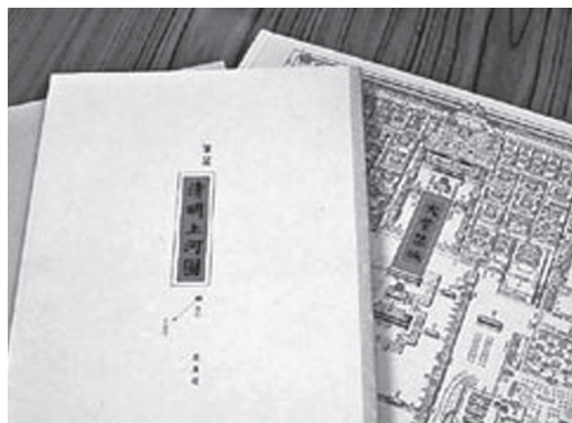
《大紫禁城——王者的軸線》榮獲印製大獎。

此外，在搜書的過程中，我又發現到在外地，例如歐洲、日本及台灣等，他們出版題材不只廣泛，還常配以不同的印製技術。圖書的效果是否美觀、讀者是否喜歡是非常主觀的，當中又夾著市場因素，但最少可看出他們積極使用不同的製作技術和物