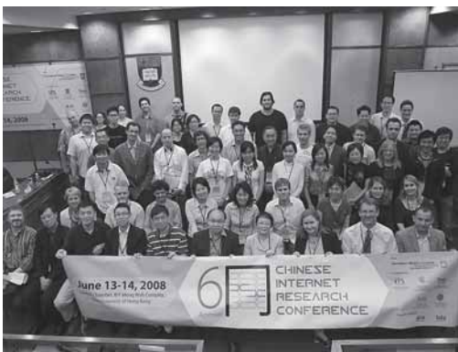
「中國互聯網研究年會」首次在香港舉行。

虛擬世界中的網民心態，從調查結果反映，沒有太大落差，一億四千四百七十多萬人，網民