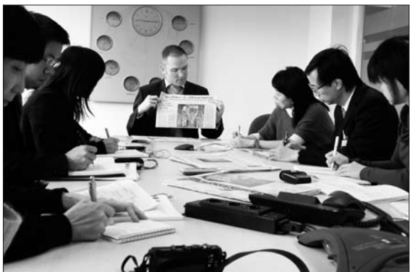
金融時報展示的合併與收購財經世界。

它有四個項目選擇：BBC推介、你喜歡收看、其他人喜歡、你朋友的推介，而且有四種不同電腦畫面素質選擇。節目可隨iPlayer跟受眾到家中、辦公室、手機。觀眾可即時用「shout」按扭表達意見，又可透過連結轉到其他廣播商的頻道。BBC認為，此服務的成功秘訣在於有好的科技，和大量適合的節目內容。新科技拓展了媒體服務範圍和素質，更方便和貼近個人的喜好。