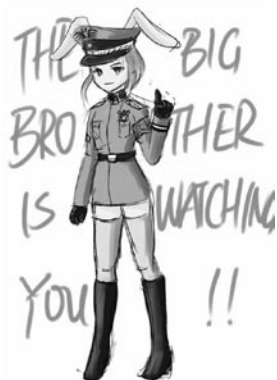
網民塑造「綠壩娘」，以惡搞調侃表達不滿。

同時，該事件還以各種方式被惡搞。國產卡通漫畫形象「綠壩娘」的誕生是其高峰。網友將綠壩軟體塑造成一個「手戴風紀袖章、懷抱赤兔、戰鬥力四千萬（綠壩的價格）、外貌傲驕實則一推就倒大小姐」，與之相關的原創小遊戲「綠壩娘的河月蟹日」、改編自日本動漫歌曲的「綠壩娘之歌」也在網路上盛行，極盡惡搞調侃之能事。然而從六月十六日開始，該卡通形象在國內互聯網上遭封殺：用百度搜索引擎直接搜索「綠壩娘」關鍵字會被提示「搜索結果可能不