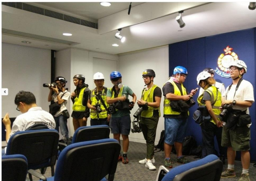
多名在場攝影記者戴上頭盔、戴上口罩，表達對警方連日來在反修例示威中，阻礙記者採訪。 2019-06-13 HKT 17:05

六月份是香港躁動的一個月，為了反對通過修訂<逃犯條例>，市民一連多日走上街頭，繼六月九日有 103 萬人上街，六月十六日更多至 200 萬人，強大的民意終於迫令政府暫緩有關修例。但政府對示威者多項訴求仍漠視不理，令整個六月都在劍拔弩張的情況下渡過。警員、醫護、法律界等在不同程度捲入風波，連謹守中立的前線記者亦不能倖免。首先是警方在六月十二日開槍鎮壓示威，令金鐘一帶街頭馬路成為戰場。先有香港電台一名運送攝影器材的外判司機，在中信大廈外下車休息時疑被警